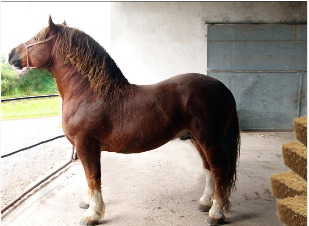
Stallone di razza Tiro Pesante Rapido