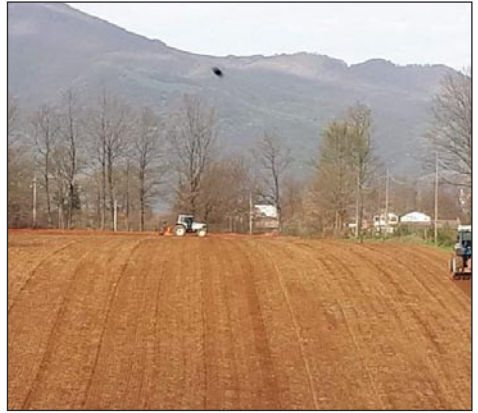
Letto di semina